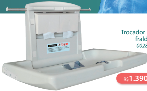
Trocaador de fraldas 002868