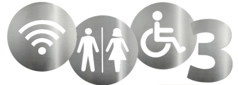
BIOTAG - Diversos modelos