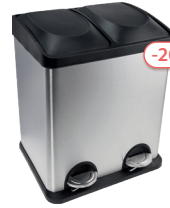
-20% Lixeira Coleta 30L 000299