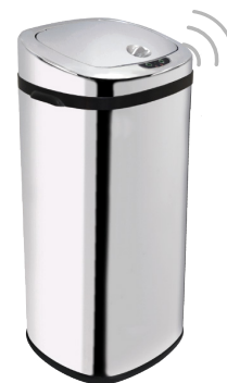
LIXEIRA BIONOX 42L 001543

Dimensões: 57x28x25cm Altura com tampa aberta: 71cm Peso líquido: 2,700kg Matéria prima: aço inox 410 polido (tampa em plástico cromado) Alimentação: 4 pilhas alcalinas AA