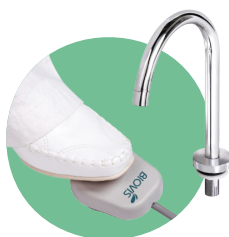
AQUA T20 127V: 001865 220V: 002037

Acompanha: válvula, flexível e pedal. *NÃO ACOMPANHA TORNEIRA.