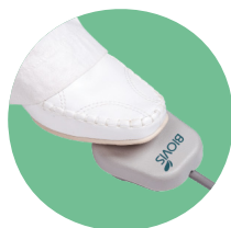
AQUA ST 127V: 14.07.05 220V: 14.07.06

Pressão da água: 0,5 a 5kgf/cm 2 | Matéria prima: pedal em plástico ABS e torneira em aço cromado