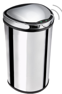
LIXEIRA BIONOX 25L 000806

Dimensões: 40x28x25cm Altura com tampa aberta: 55cm Peso líquido: 2,200kg Matéria prima: aço inox 410 polido (tampa em plástico cromado) Alimentação: 4 pilhas alcalinas AA