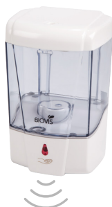
SABONETEIRA SENSOR LUNA 001025

Dimensões: 25,5x12,5x13cm Capacidade: 1000ml Peso líquido: 0,840kg Volume dispens.: 6ml (espuma) Matéria prima: - dispenser em plástico ABS - reservatório plástico Alimentação: 6 pilhas AA / adaptador Bivolt