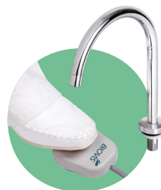
AQUA T28 127V: 14.07.03 220V: 14.07.04

Acompanha: torneira de 20cm de altura, válvula, flexível e pedal.