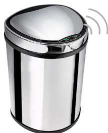
LIXEIRA BIONOX 12L 000805

Dimensões: 26x24x24cm Altura com tampa aberta: 39cm Peso líquido: 1,300kg Matéria prima: aço inox 410 polido (tampa em plástico cromado) Alimentação: 4 pilhas alcalinas AA