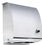
TOALHEIRO VISIUM 13.01 (polido) 13.15 (escovado) Material: Aço inox 430 A:275 / L:250 / C:125mm