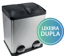
LIXEIRA COLETA 30L 000181 Material: aço inox 410 (tampa e balde interno em plástico) A:470 / L:400 / C:340mm