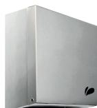
TOALHEIRO QUADRA 005470 (polido) 005488 (escovado) Material: Aço inox 430 A:280 / L:240 / C:115mm