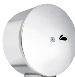
PORTA ROLÃO VISIUM 13.02 (polido) Material: Aço inox 430 A:270 / L:260 / C:115mm