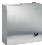
TOALHEIRO NOBLE 001029 (escovado) Material: Aço inox 430 A:255 / L:365 / C:105mm