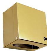
TOALHEIRO NOBLE DOURADO 006407 Material: Aço com pintura eletrostática A:280 / L:240 / C:115mm