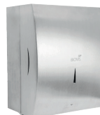
TOALHEIRO AUTOCORTE NOBLE 001027 (escovado) Material: Aço inox 304 A:380 / L:300 / C:220mm