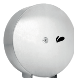
PORTA ROLÃO NOBLE 001028 (escovado) Material: Aço inox 430 A:270 / L:260 / C:115mm